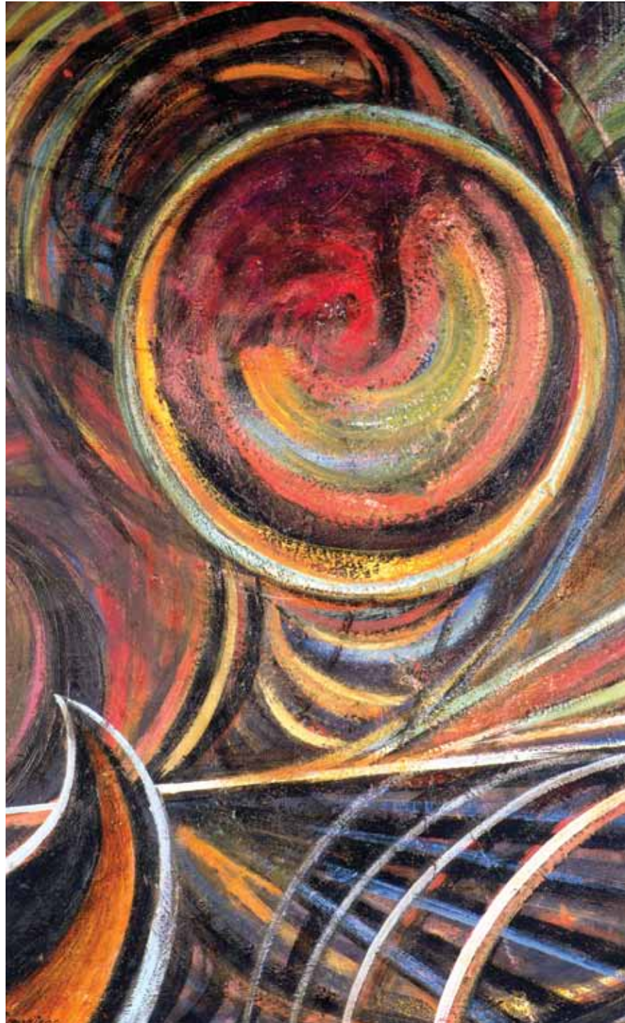
David Alfaro Siqueiros, Movimiento espacial , 1967 (fragmento, gentileza Christie's)

Lo dicho en el párrafo anterior sobre la relación entre calidad de la oferta pública y matriculación en privada admite también otra perspectiva de análisis. Estudios con familias (3) dan cuenta de que algunos de los nuevos segmentos sociales que eligen crecientemente escuelas privadas lo hacen no a partir de una mejor consideración de su calidad educativa, sino de otros atributos que los especialistas no suelen incluir bajo esta denominación tales como: el mayor orden percibido en este tipo de escuelas, la sensación de cuidado y protección que ofrecen (señalada en especial por