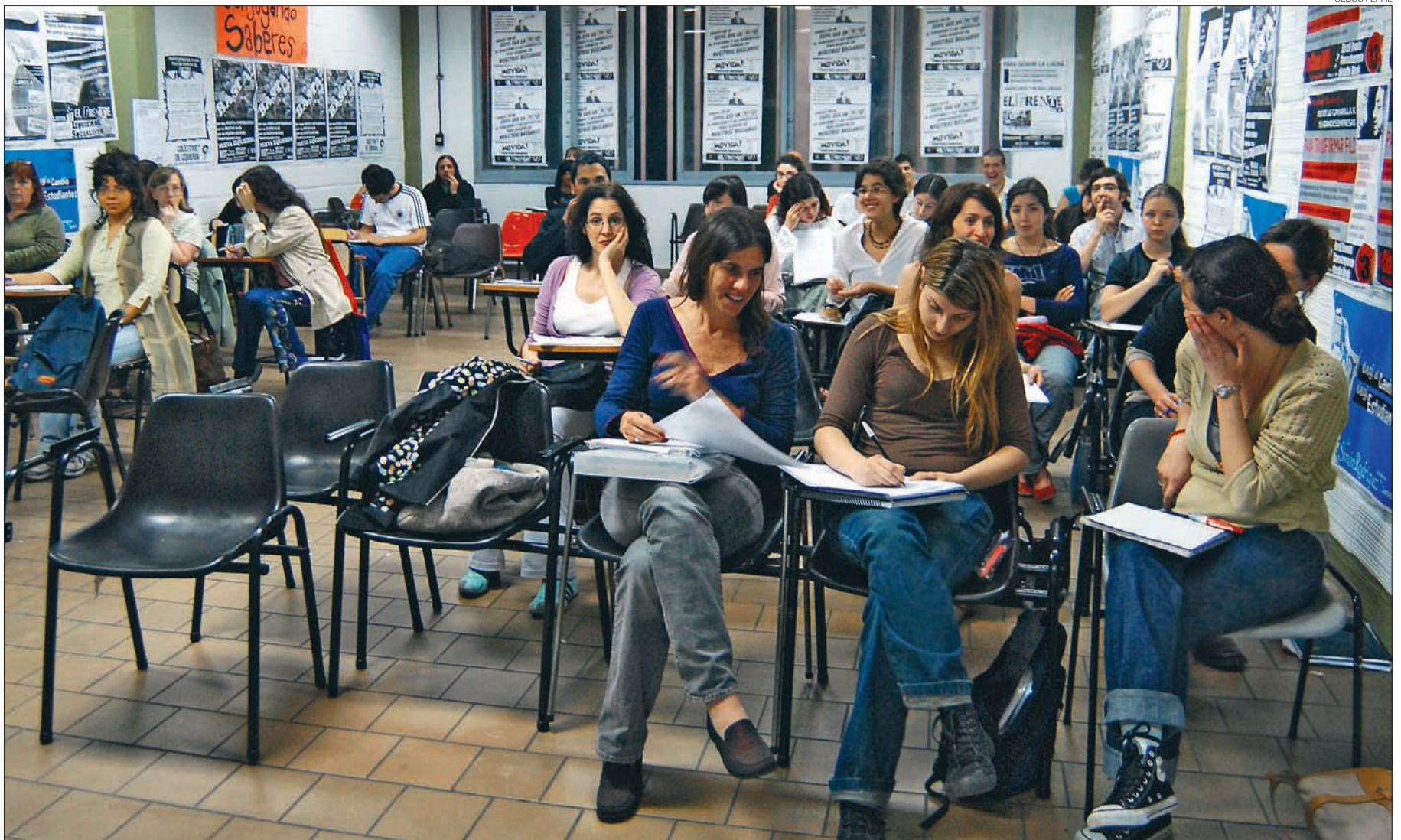
CLASES. A través de los años, el sector femenino fue ocupando mayores lugares en la vida estudiantil. El acceso a la educación es uno de los aspectos a tener en cuenta.